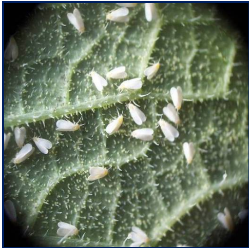
Adulto de Mosca Blanca

El mejor control es el de hacer las practicas básicas a tiempo, limpieza de los bordes de los lotes, colocar trampas amarillas para muestreo, el muestreo de las plantas y aplicar el agroquímico correcto para su control (Tabla 3). Las aplicaciones se deben dirigir al envés de la hoja que es donde ellos se alimentan y se debe hacer calibración con lámpara fluorescente para asegurar que el producto se está poniendo donde está la plaga. Al final del cultivo es imperativo eliminar totalmente los rastros y hacer rotación con cultivos como sorgo, maíz o cebolla.