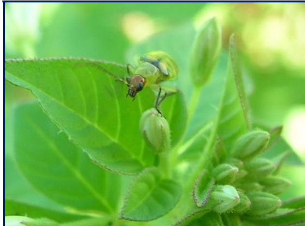
Diabrotica balteata adulto

Las hembras adultas ponen huevos anaranjados-amarillos alrededor de la base del frijol u otras plantas hospederas. Al salir del cascarón las larvas blancas con cabezas negras hacen una madriguera en el suelo para alimentarse de raíces y tallos bajo la tierra. Ellas pupan en el suelo antes de surgir como adultos.