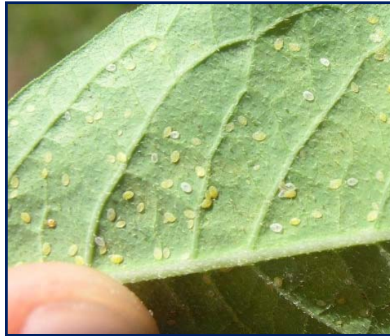
Ninfa de Mosca Blanca