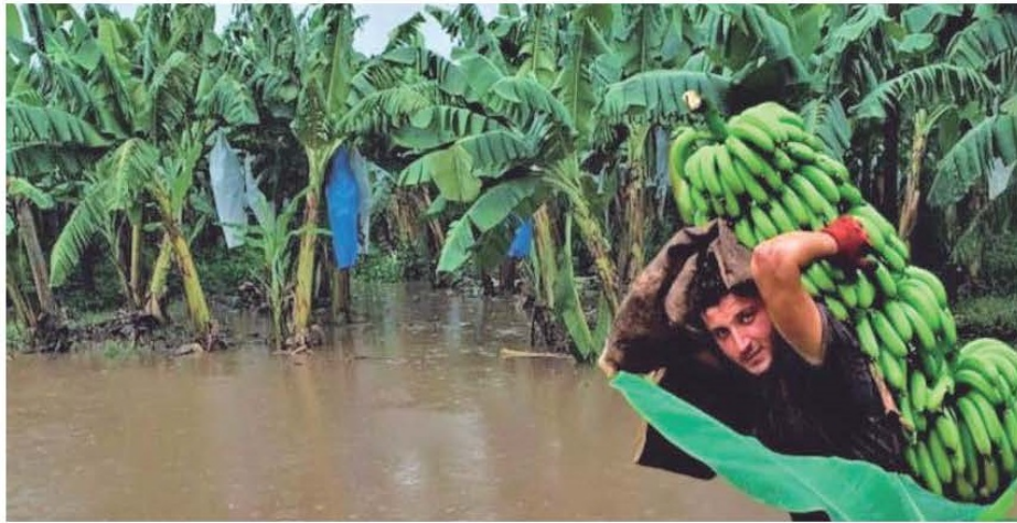
La agricultura resultó afectada una vez más en un momento que mostraba tasas positivas luego de un prolongado período de caídas desde 2021.